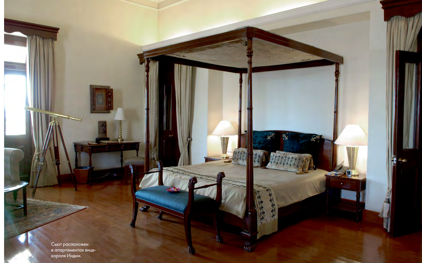
Сьют расположен в апартаментах вице-короля Индии.

части дворца сервируют полуденный чай по всем английским правилам, а в распоряжении поклонников бильярда — стол, за которым играли королевские особы. Основное же здание отеля расположено вниз по холму — такая стратегическая позиция гарантирует вид на горы и долину Ганга. А как вы будете им наслаждаться — из кровати или из ванны — решать вам. Но созерцание природы — не единственное развлечение. Хотя они здесь иногда напоминают спорт — в программу отдыха можно включить пешее восхождение на высоту 2500 метров. Главное, зачем стоит ехать в Гималаи, — внутреннее спокойствие, и если вы проведете день в спа, где розовые ванны сменяются массажем в четыре руки, а тибетский ритуал для лица — терапией с горячими камнями, никто вас не осудит. Ведь за этим в Гималаи приезжали даже махараджи. www.anandaspa.com