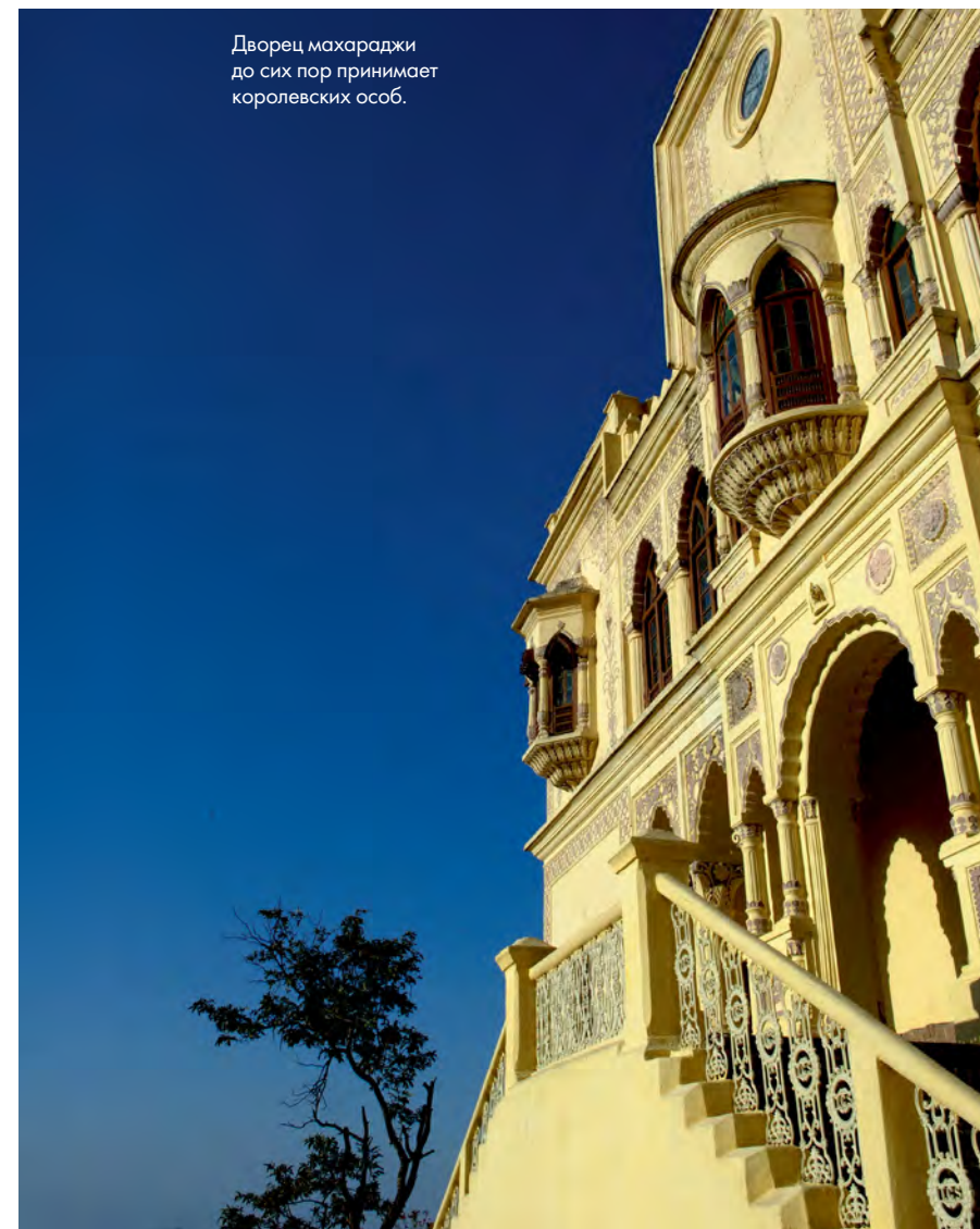
Дворец махараджи до сих пор принимает королевских особ.