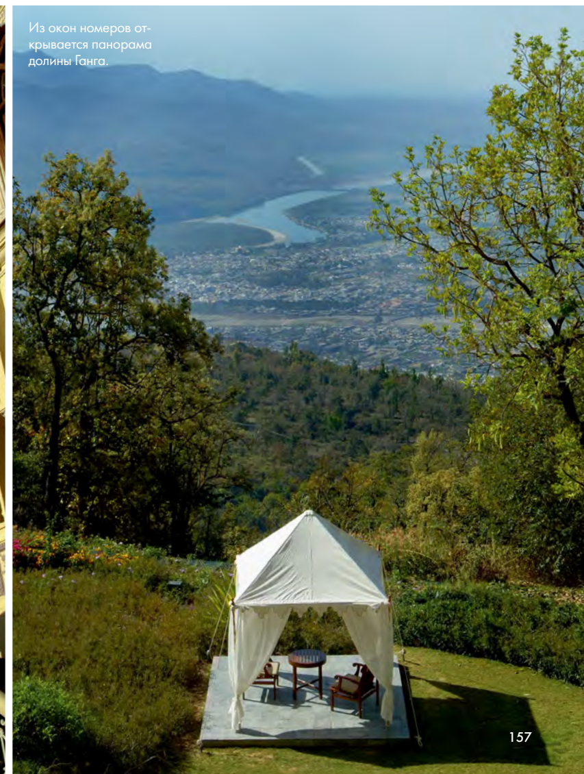
Из окон номеров открывается панорама долины Ганга.

Стиль ар деко должен был напоминать вице-королю о метрополии, а индийский колорит — о его должности.