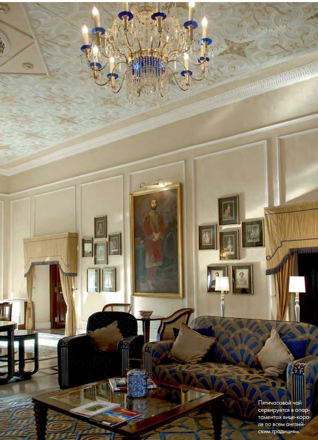
Пятичасовой чай сервируется в апартаментах вице-короля по всем английским традициям.